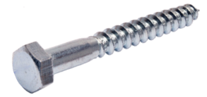
DIN571 Γαλβανιζέ Σίδηρος Στριφώνια