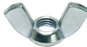
0315 Γαλβανιζέ Σίδηρος Πεταλούδες (BSW)