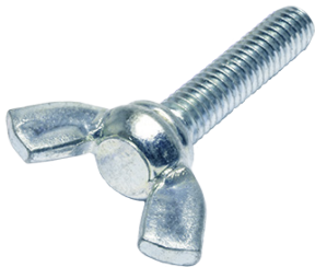
DIN316 Γαλβανιζέ Σίδηρος Πεταλούδες αρσενικές